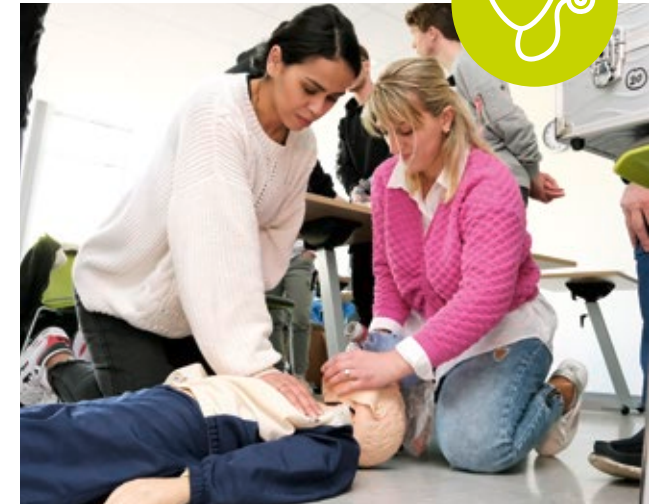
Die generalistische Pflegefachausbildung am BZPG befähigt zur Pflege von Menschen aller Altersstufen in drei Versorgungsbereichen.